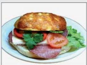
5. Salami- & brie fralla 32:- (29:-)