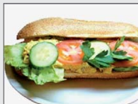
2. Kycklingbaguette 35:- (32:-)