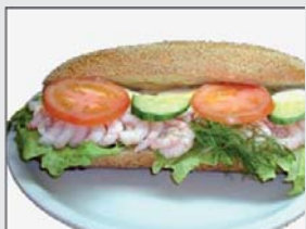
1. Skagenbaguette 35:- (32:-)

(Pris inom parentes gäller vid avhämtning)