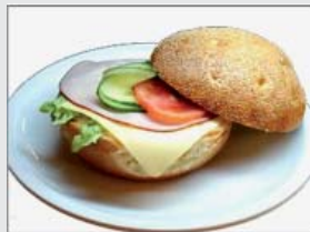
4. Ost- & skinkfralla 19:- (17:-)