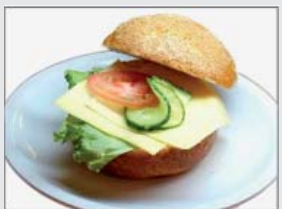
3. Ostfralla 19:- (17:-)