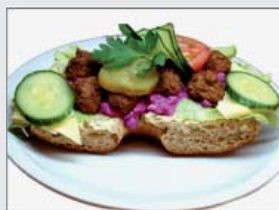
6. Köttbullemacka 32:- (29:-)