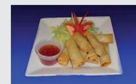
Veg vårrullar (ris ingår)