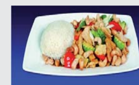
Gai phad (Cashew chili)